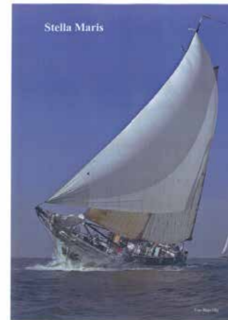
Zeezeilen met een klassiek zeilschip www.stella-maris.net