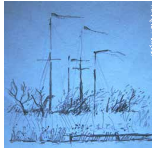
Tekening Alice Hoogstad