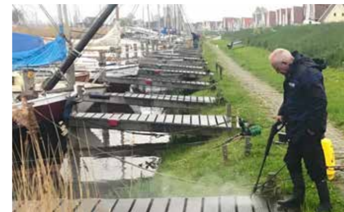
Boven: Henk Wouters bedient de hogedrukspuit Onder: Puntsteiger voor en na de spuitbeurt. Geen geglibber meer bij het op en afstapen van de boot!