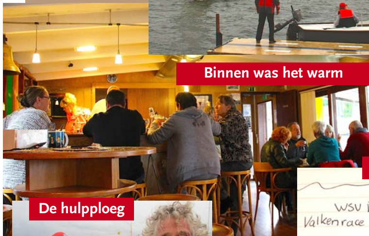
Binnen was het warm